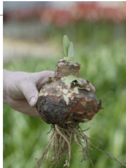
Hoe groter de bol, des te meer bloemstengels hij geeft.