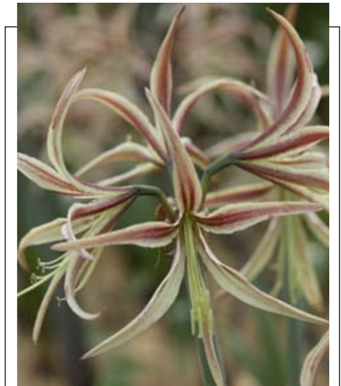
Cybisters worden ook wel spintype genoemd, vanwege hun smalle bloemblaadjes.