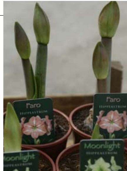
Amaryllis op pot, die via de bloemist verkocht wordt, geeft al in twee weken uitbundige bloei.